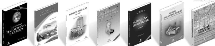
Земная жизнь и её блага