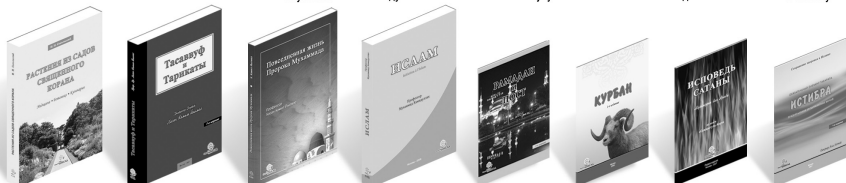
Растения из садов Священного Корана