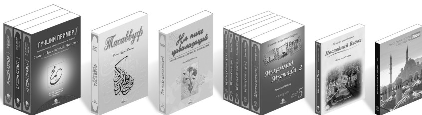
Лучший Пример - 1, 2, 3