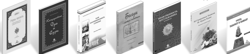
Учусь читать Коран