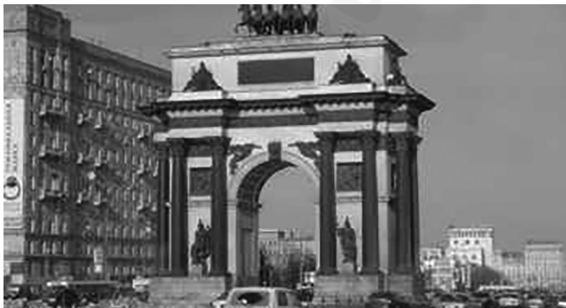
Триумфальные ворота, воздвигнутые в честь победы над Наполеоном

Убийство Ураком Лжедмитрия II перевернуло историческую страницу Смутного времени и «объективно оказало огромную услугу российской государственности» 1 . Новая угроза — интервенция поляков — заставила пересмотреть политические взгляды мусульман Центральной Руси; об участии нескольких татарских отрядов в ополчении князя Пожарского (1611-1612 гг.) сообщает С.М.Соловьев 2 . Наконец, на Земском Соборе 1613 г. несколько татарских мурз участвовали в утверждении на московский престол царя Михаила Романова.