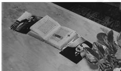
Предсмертный Коран Мусы Джалиля и фото муллы Усмана

Я не могу забыть тот день. Да его и невозможно забыть. 20 августа прошлого года (1944) меня позвал Шафи и сказал: «25 августа приведут в исполнение смертный приговор для Мусы и его товарищей, необходимо твое присутствие, об этом сообщил Главный Муфтий». В тот день рано утром я пошел в тюрьму Плетцензее и сначала поговорил с тюремным пастором. Пастор обрадовался моему приходу. Он сообщил мне, что татары будут расстреляны в 12 часов. По словам пастора, приговоренные к смерти татары находятся в одной большой комнате, и им не верилось, что их расстреляют. Пастора они всегда принимали тепло и высказывали ему свои жалобы.