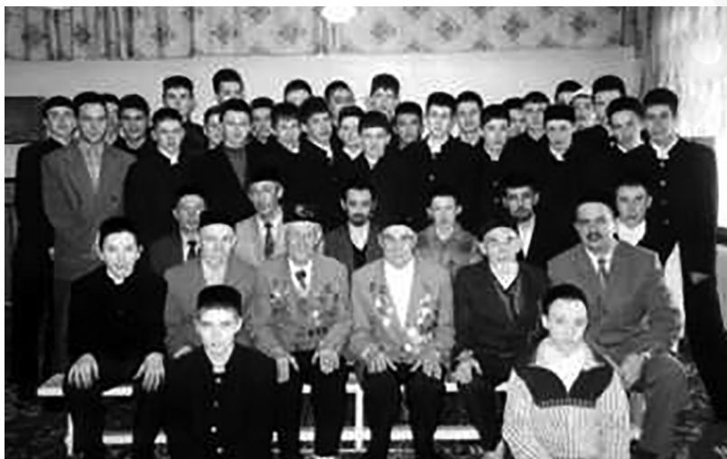
Фасыйх-хазрат Гафиев на встрече с учениками средней школы Черемшанского района РТ

мусульманского вероисповедования, пример с мухтасибатом наиболее показателен.