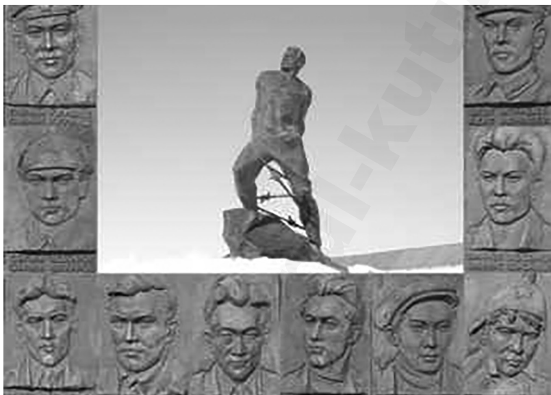
Муса Джалиль и его соратники

бургской области помимо Корана было много религиозных книг. Поэтому Муса с детства воспитывался в духе ислама. В Оренбургском медресе «Хусаиния», как и все, он изучал религиозные предметы и, по словам его товарищей, знал наизусть некоторые суры Корана. Действительно, в советскую эпоху Джалиль был комсомольцем, затем вступил в Коммунистическую партию, отрекся от религии, выступал против нее. Однако в час смерти он вернулся в религию, видимо, вера все же в нем жила, несмотря на внешнее отречение.